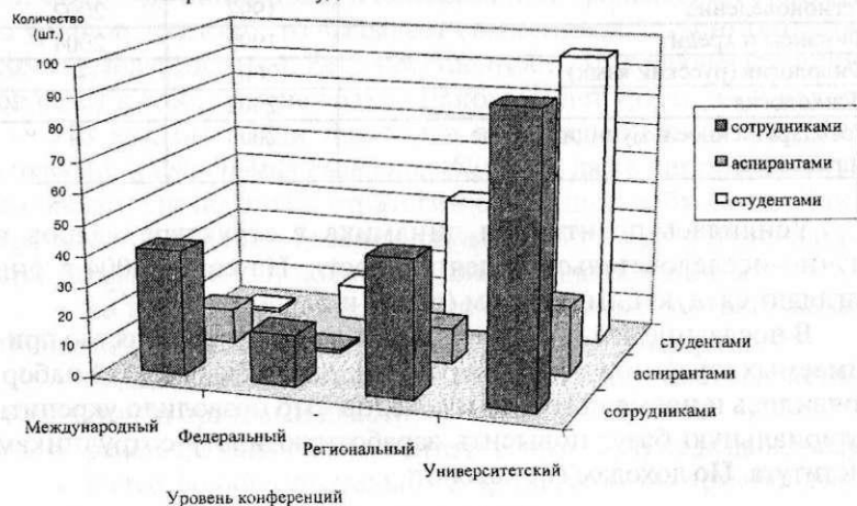
Рис. 1. Научно-исследовательская деятельность в ВГИ (филиале) ВолГУ