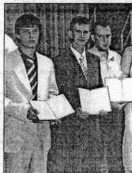
• Дипломы получены!

Кстати, слушатели МАН регулярно становятся призерами конкурсов, проводимых в подмосковном Обнинске. Разумеется, многие потом поступают в