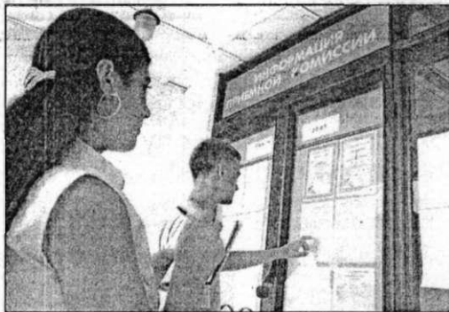
• Сегодня абитуриенты, завтра – студенты.

ставить без Волжского гуманитарного института. Да, Волжский за сравнительно короткий срок вошел в число российских городов, которые считаются студенческими мегаполисами. Здесь возник ряд вузов и фи-